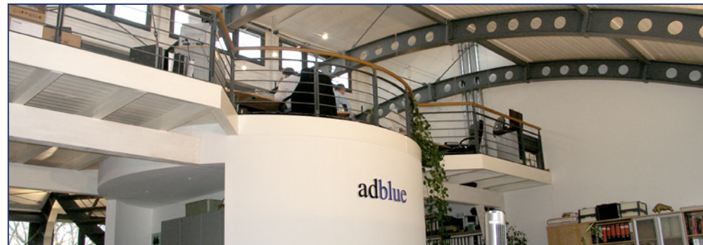
adblue Headquarter | Berlin - Germany

Tel: 0049 (0)30/ 243 42 -0 Fax: 0049 (0)30/ 243 42 -29 Internet: http://www.adblue.de Email: info@adblue.de